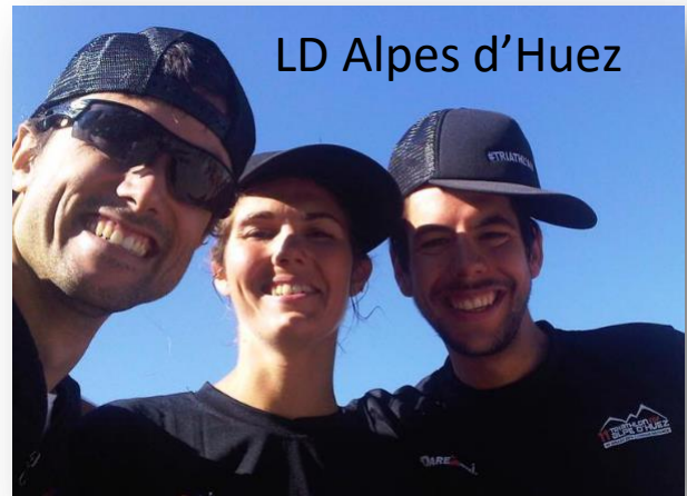
LD Alpes d'Huez

En tout cas, même en juillet, les aixois ne s'arrêtent pas !